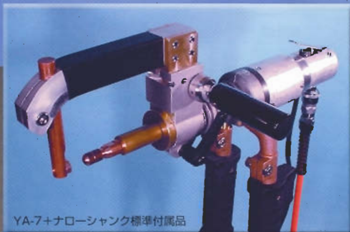
YA-7+ナローシャンク標準付属品