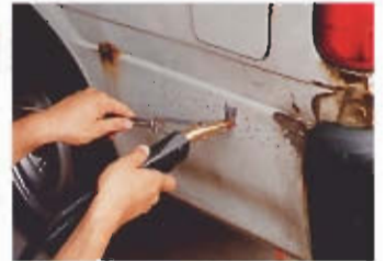
そのまま折りたためばすぐにシボリ作業