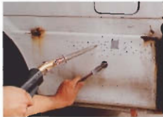
そのままハンマリング作業