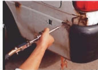
ハンマーを使っただけの箇所を引き出し