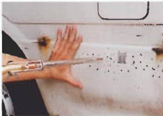
広い面はソフトに引き出し